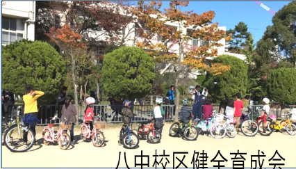
八中校区健全育成会

11月9日（土）小学校校庭にて自転車乗り方教室を開催いたしました。当日は約30人の子供達が参加してくれました。まずは豊中警察の方から交通ルールについて話をお伺いしました。「はらぶたべさ」を知っていますか？これはハンドル・ライト・ブレーキ・タイヤ・ベル・サドルのことで、自転車に乗る前の点検箇所を示す言葉と教えていただきました。お話の後は横断歩道の渡り方など、ルールに従い一つ一つ確認をしながらグラウンドに設けられたコースを自転車で走りました。歩道を走行することを想定し、どれだけスピードを落として走行できるかを試す運転や、ジグザグ運転といった、普段とは違う乗り方の練習は難しかったようで、みなさん苦戦されていました。参加してくれた子供にとっても、見守ってくださった大人にとっても、交通安全やルール、また自転車の乗り方マナーについて、再確認できた一日となりました。